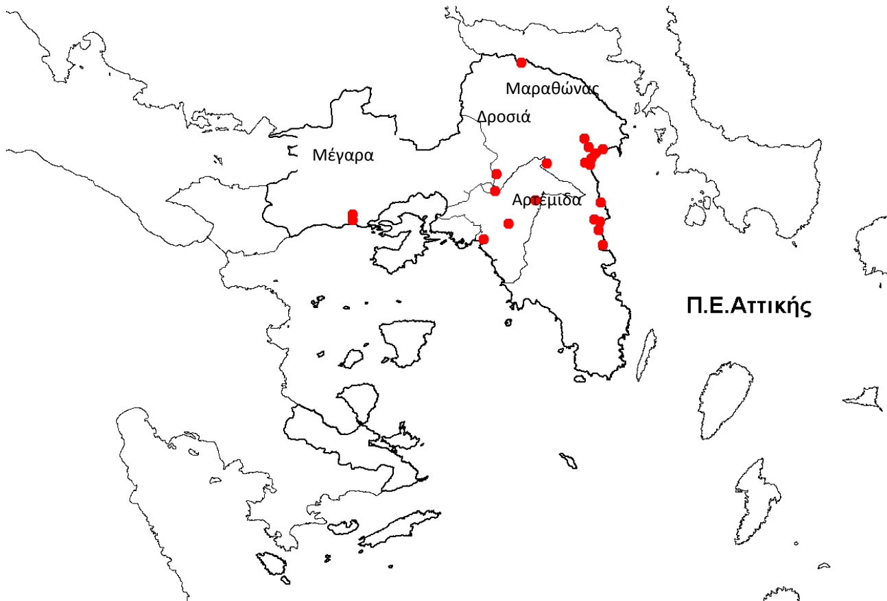
Εικόνα 3: Χάρτης με αποτύπωση του τόπου κατοικίας των ασθενών με εργαστηριακή διάγνωση λοίμωξης από τον ιό του Δυτικού Νείλου με εκδηλώσεις από το κεντρικό νευρικό σύστημα στην περιοχή της Αττικής, Ελλάδα, 2011