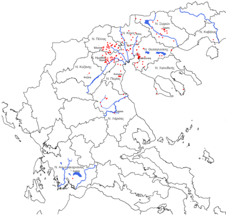
Εικόνα 2: Χάρτης με αποτύπωση της προέλευσης των ασθενών που έχουν διαγνωσθεί με λοίμωξη από ιό του Δυτικού Νείλου με εκδηλώσεις από το κεντρικό νευρικό σύστημα (κυρίως εγκεφαλίτιδα ή/και μηνιγγίτιδα).

Πηγή: ΚΕΕΛΠΝΟ* Κάθε κόκκινη κουκίδα αναπαριστά ένα εργαστηριακά διαγνωσμένο κρούσμα.